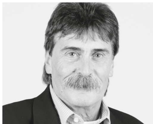
von Hanspeter Stoll, Departement Forstwesen, Deponien Lindenstock und Elbisgraben

Wer kennt sie nicht? Die Rottanne («Picea albies»), die gemeine Fichte mit ihren nach unten hängenden, holzigen Zapfen, den Freiheitsbaum, den wichtigsten Nadel- und Ertragsbaum Europas. Wer kennt sie nicht? Die Rotbuche («Fagus silvatica»), die Mutter des Waldes mit ihrer bis zu maximal 35 m kuppelförmigen Krone, ihren dreikantigen, kastanienbraunen Nussfrüchten