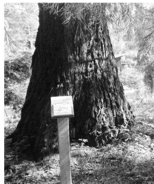
Mammutbaum – Sequoiadendron giganteum